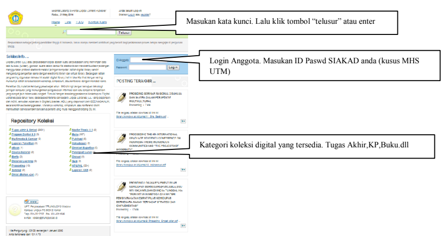
Gambar 2. Halaman “digital library”